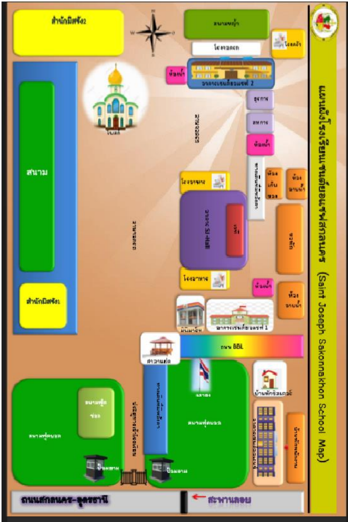
แผนผังอาคารสถานที่โรงเรียนเซนต์ยอแซฟสกลนคร